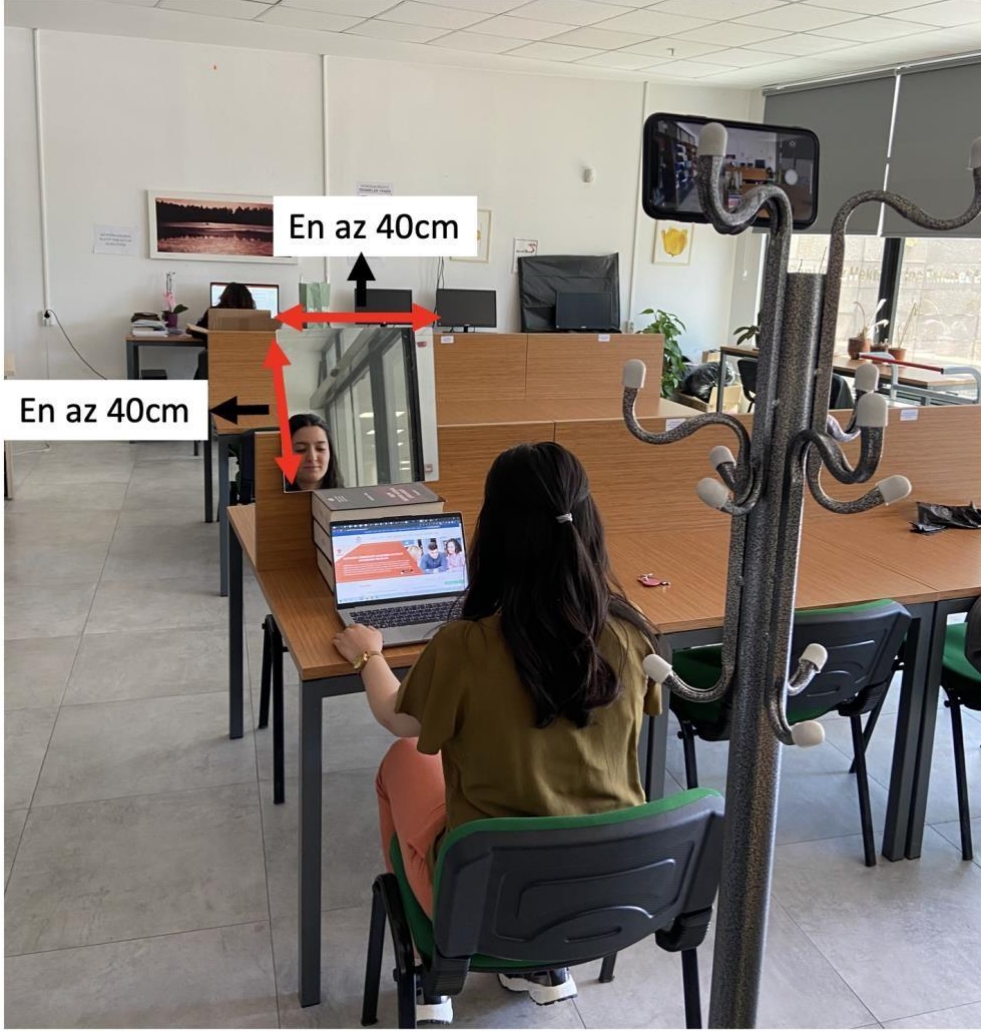
Şekil 3. Aynanın konumu ve boyutları