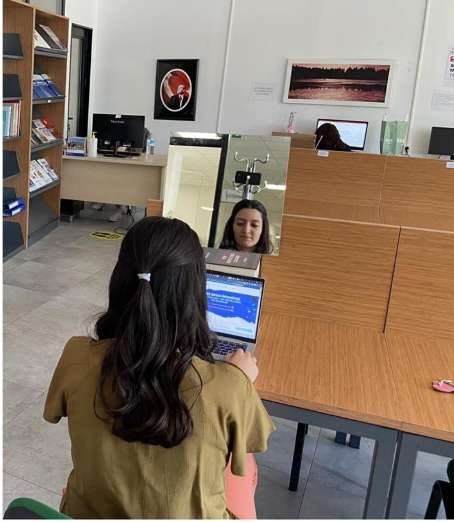
Şekil 1. Aynanın konumu – Sınava girilecek cihazın arkasında ve yukarısında olup, öğrencinin yüzünün tamamı aynadan görünmelidir.