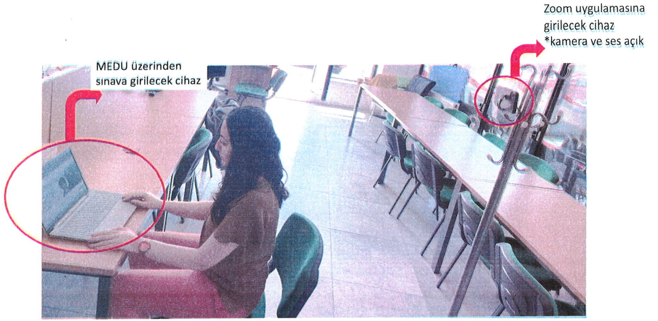
Şekil 2. Ayna-kamera açısı – Kamera aynanın karşısında ve sınava girilecek cihazdan yüksekte konumlanmalıdır